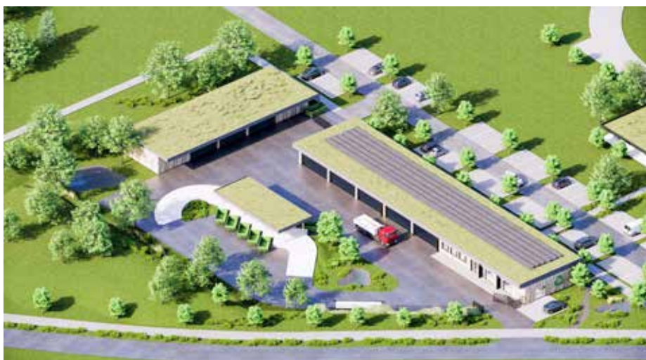
Nový sběrný dvůr a sídlo technických služeb