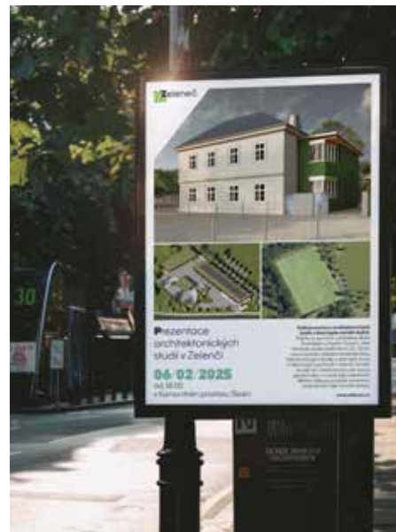
Ukázka použití loga a vizuální identity

kteřé zároveň v sobě nese dynamiku a vyznačuje se velkou znělostí. Hledal jsem symboliku těchto prvků a takto došel k ideové grafické zkratce. Vytvořil jsem si něco jako myšlenkovou mapu, na jejímž základě nové logo vznikalo.