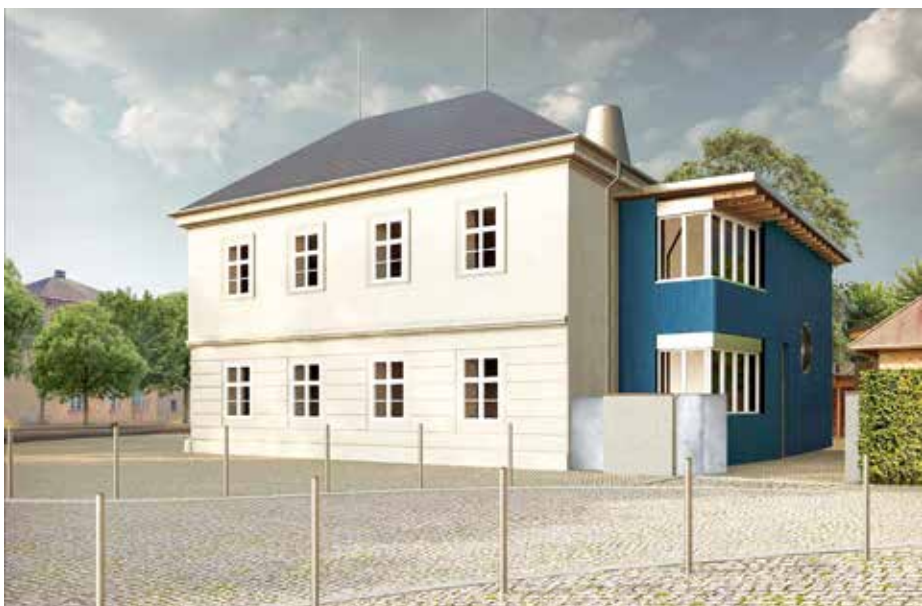
Č.p. 38 - budoucí základní umělecká škola

Uprostřed dvora vznikne nájezdová rampa, kam budou lidé přijíždět svými auty a pohodlně vysypávat odpad do příslušných kontejnerů pro tříděný odpad. Stejně jako dnes bude možné i mimo provozní dobu přivést trávu a uložit ji do kontejnerů umístěných vně oplocené části areálu.