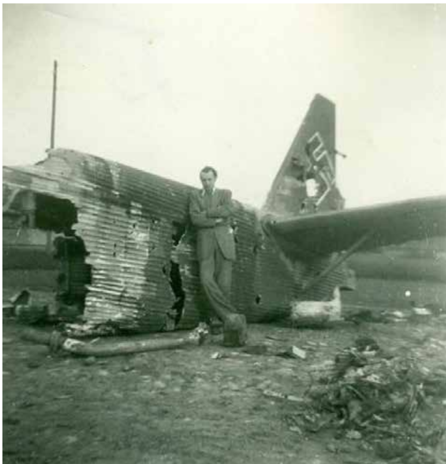
Vrak Junkersu JU-52, který u Nehvizd poničili na konci války piloti z 368. stíhací skupiny. Příležitost vyfotit se u trosk letadla si nenechala ujít spousta místních.