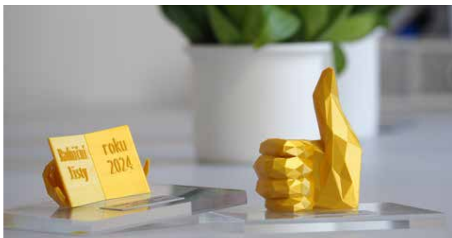
Ocenění Radniční listy 2024 a Zlatý lajk 2024

Pozadu nezůstal ani náš Zelenečský zpravodaj, který získal také vysoké hodnocení. Zde spolek ocenil moderní grafické zpracování, kvalitní texty a informační přehlednost. Zvláště byla zvýšena různorodost obsahu, která přesahuje úřední informace a zapojuje místní spolky, školy, sportovní kluby a další organizace. Texty jsou čtivé, poutavé a mají vysokou jazykovou úroveň. Kladně byla hodnocena také publikace přehledu usnesení zastupitelstva, což není u všech obecních periodik samozřejmostí. Také grafické zpracování bylo označeno jako velmi profesionální. Jedinou výtkou byla titulní strana, na kterou jsme okamžitě zareagovali a jak jste si mohli všimnout, po dvou letech jsme ji obměnili. I přesto zpravodaj nasbíral 49 bodů z 50, což považujeme za mimořádný úspěch. V celkovém hodnocení to znamenalo 2. místo v okresním a 8. místo v krajském kole.