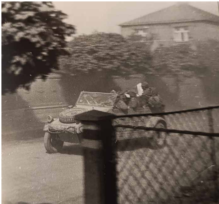
Německý Kdf 82 „Kübelwagen“ s ustupujícími německými vojáky, kteří byli ještě v dubnu 1945 odhodlaní bojovat, poblíž železničního přejezdu v Zelenči. Snímek je pořízen z bezpečného úkrytu (Foto: archiv rodiny Malých).

Devadesátiletý zelenečský rodák Milan Enc vzpomíná na souboj dvou stíhaček u Zelenče. „V lednu 1945 jsem viděl nad vsí ve velké výšce bojující letadla. Točila se v kruzích a byla slyšet jejich střelba. Za chvíli od jednoho letadla odletělo křídlo, které dopadlo až někde u Čelákovic. Pak letadlo spadlo za baráky do polí. Výbuch skoro nebyl slyšet, dopadlo napplocho a moc nehořelo. To se ví, že jsem hned pelášil za humna k Dehtárům. Tam už bylo hodně lidí a zrovna tahali mrtvé-