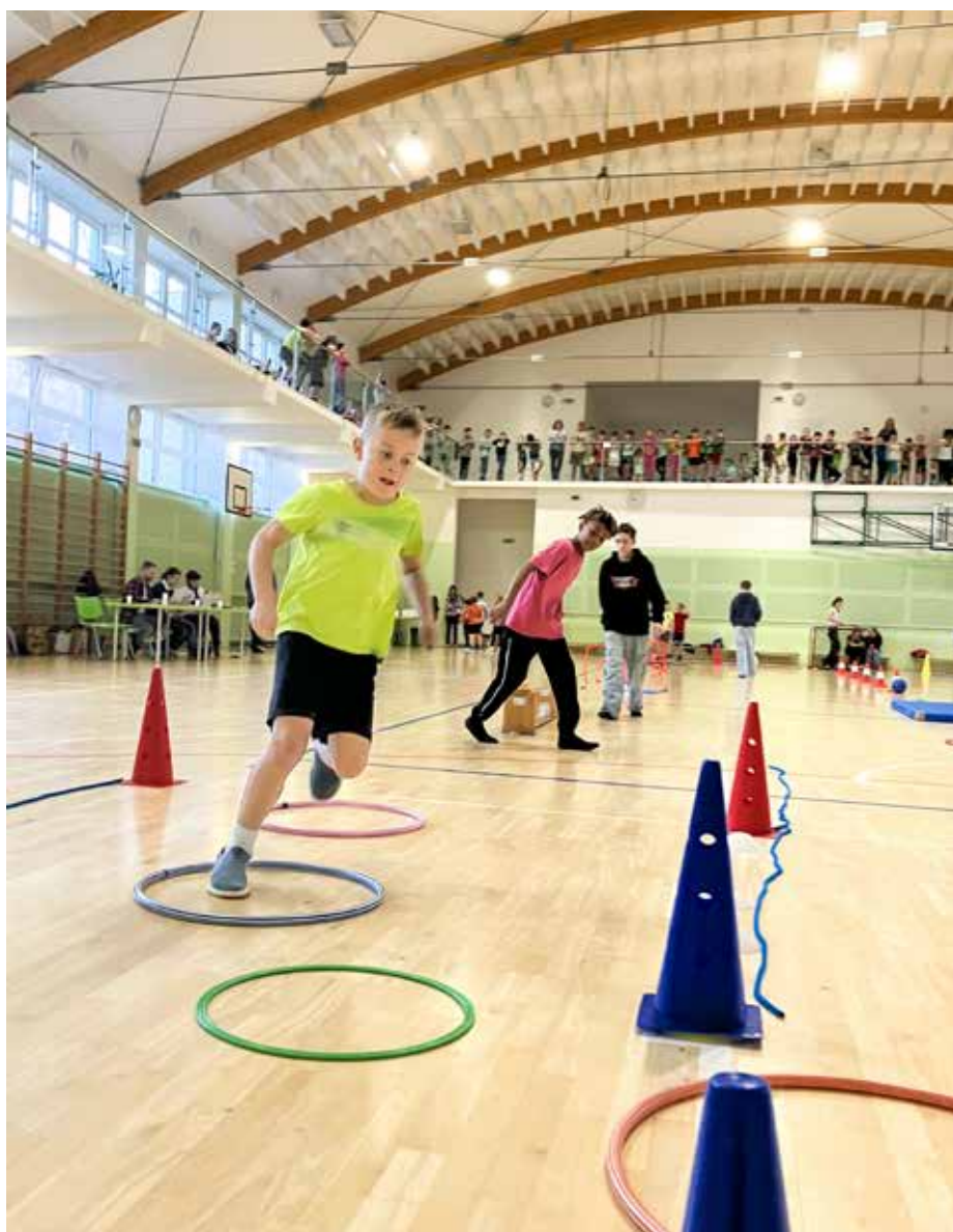
Překážková dráha pro žáky 1. až 3. tříd

Aleš Suchý Koordinátor školního parlamentu