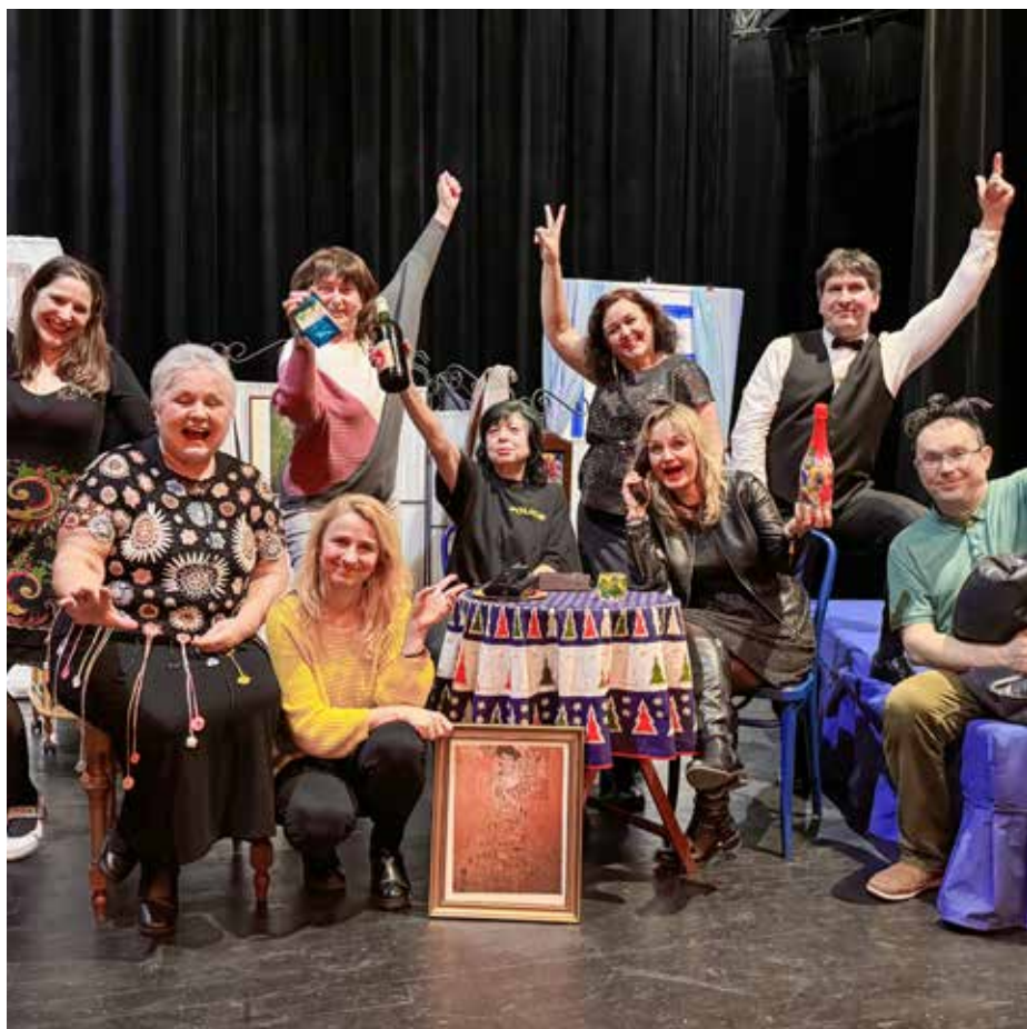
Členové ochotnického spolku Amazelus