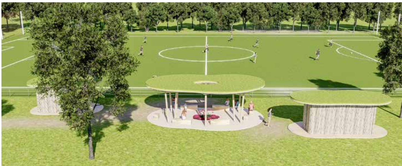
Nové tréninkové hřiště

Bude zde i hala na třídění části dovezeného odpadu. V areálu vzniknou kromě zastavěných ploch a ploch manipulačních i nové plochy zeleně, které vnitřní provoz pohledově odcloní, budou ale také plochami pro retenci dešťové vody.