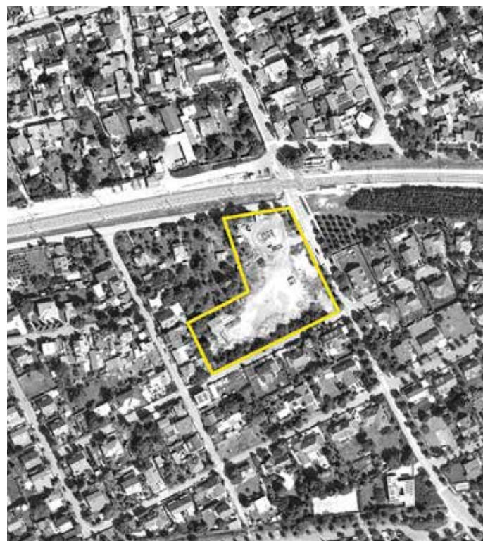
Bývalá lištárna se nachází v rohu ulic Čsl. armády a Kmochova v těsné blízkosti vlakové zastávky