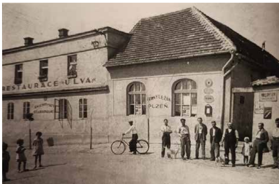
Dnes již zbořený hostinec U Lva v Zelenči se stal v dubnu 1945 přechodným ubytovacím prostorem pro německé civilní uprchlíky a o měsíc později domovem sovětských vojáků. (Foto archiv M. Kubáňka).

Stále častěji se lidé setkávali s tzv. hloubkovými letci, které lidově nazývali „kotlináři“. Jejich specialitou bylo přepádání vlaků, zvláště lokomotiv. Ostatně pojmenování „kotlináři“ pocházelo z toho, že jejich nejčastějšími cíli v okupovaném Československu byly kotle parních lokomotiv, které z palubních zbraní rozstříleli. Kupříkladu 18. dubna 1945 se v Mstěticích objevilo šest letounů P-47