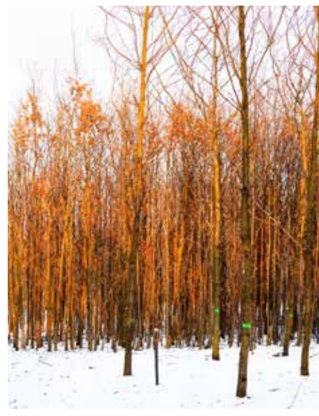
První pěstební probírky v rámci revitalizace školky dřevin