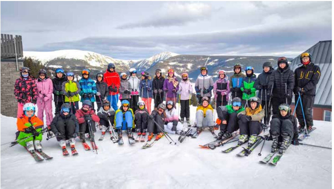
Žáci 7. a 8. tříd na lyžařském kurzu