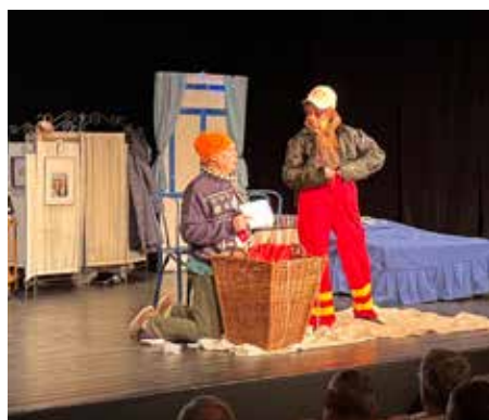
Z představení Přes přísný zákaz dotýká se sněhu

Poslední zatím plánované představení proběhlo v divadle v Horních Počernicích, kde skoro dvousetka diváků (kteří si včas pořídili vstupenku - bylo vyprodáno) mohla naplno vychutnat tuto třaska-