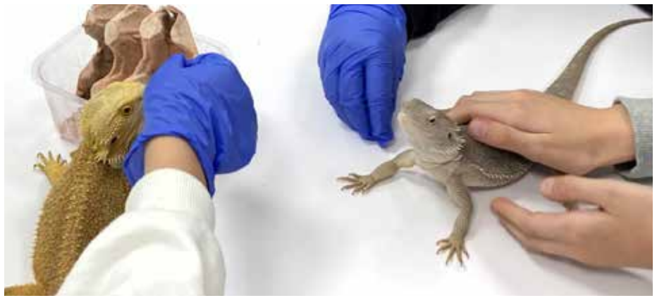
Nerozlučný pár Kuba a Rozárka - agamy vousaté

Letošní školní rok jsme náš zookoutek rozšířili o další druhy zvířat. A koho u nás vlastně najdete? Předně našeho chameleona pardálího, kterého jsme pojmenovali Filípek. Umí kouzelně měnit barvy podle nálady, je velmi společenský a rád nám šplhá po ruce. V teráriích máme nově i plšiky africké – malé, hbité hlodavce, kteří svým vzhledem připomínají miniaturní veverka. Jsou neuvěřitelně mrštní a během hodin přírodovědného kroužku po nás často skáčou. Naučili se přijímat potravu přímo z ruky a je vždy potěšení sledovat jejich hrátky. Radost nám dělají také obojživelníci. Zejména pralesničky, jedny z nejkrásnějších žabek na světě. Svými sytými barvami