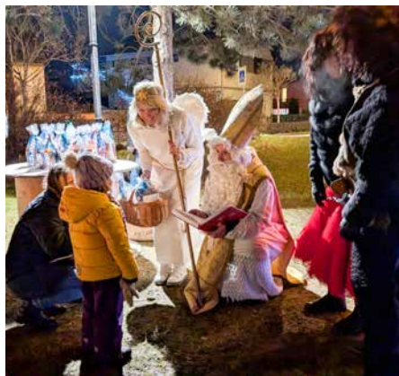
Mikuláš se svojí družinou a zeleněčskými dětmi

Stejně jako loni, tak i letos zavítal 5. prosince do Zelenče Mikuláš, anděl a dva neposední čerti. Celá družina na děti čekala v parku u vánočního stromu a právě Mikuláš s sebou měl nepostradatelnou knihu hříchů, kde byly poctivě zaznamenány nejen hříchy, ale i pochvaly dětí. Postupně se zde scházely celé rodiny, aby jejich děti odvážně předstoupily před připravenou čtveřici a vyslechly si, jak zlobily nebo jak byly naopak hodné. I když žádné dítě nebylo, jak se říká sva-