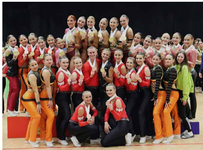
Kompletní sestava Fit studia D na Mistrovství České republiky s vítěznými medailemi.