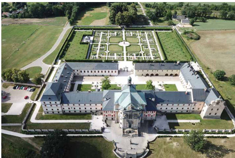
Letecký pohled na Hospitál Kuks

Před dnem svátku zesnulých jsme se plánovaně ocitli na Vyšehradském Slavnině a společně s průvodcem jsme obešli celý historický Vyšehrad a některá místa, která ještě mnozí nenašli. Byly to například podzemní Kasematy, právě rekonstruovaný starý kostel Stětí sv. Jana Křtitele nebo Katedrála Petra a Pavla, která je opravdu nádherná. Na Vyšehra-