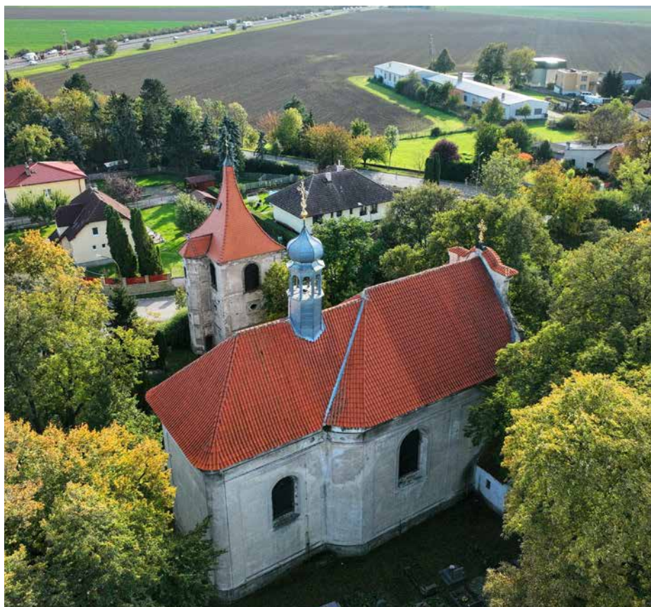
Kostel sv. Prokopa ve Svémyslicích

A tak se začala psát nová kapitola ve vedení obce. Mezi prioritami bylo vybudování chodníků spojujících starší část obce s nově vybudovanými, a také rekonstrukce stávajícího chodníku procházejícího intravilánem obce. Další klíčové projekty zahrnovaly zajištění mateřské a základní školy, zlepšení dopravní obslužnosti, rozšíření stanovišť na třídní odpad a revitalizace a odbahnění rybníka. Nechyběly ani plány na pěší propojení s okolními obcemi, jako jsou Zeleneč a Dehtáry. Také jsme hned rozjeli kulturní akce – rozsvícení vánočního stromku nebo zpívání v kostele.