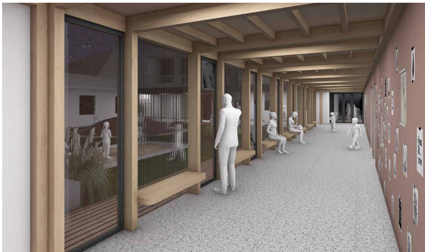
Vizualizace spojovací chodby zrekonstruované MŠ, která může sloužit i jako galerie