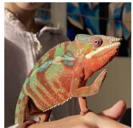
Nový člen školního zoo koutku – chameleon pardálí