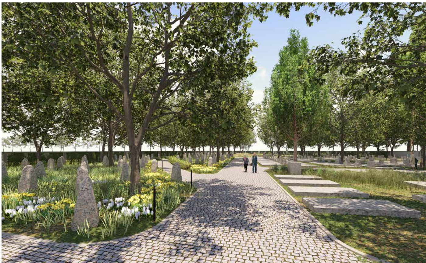
Vizualizace rozšířeného a zrekonstruovaného hřbitova