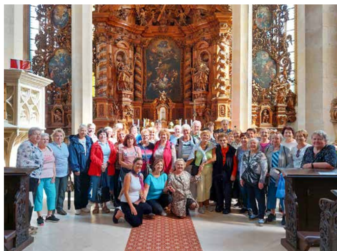
Návštěva Chrámu sv. Mikuláše v Lounech

Hned na začátku září se konal výlet do Sobotky a na zámek Humprecht. Cesta na kopeček, kde se zámek nachází byla náročná, ale o to víc jsme si užili následnou prohlídku s průvodkyní, která nevynechala zajímavosti tohoto místa, jako je například velký sál s úžasnou akustikou. Museli jsme této příležitosti využít a zazpívat si alespoň jednu píseň. Celý zámek byl postaven jako lovecký s kruhovým půdorysem a věží uprostřed. Z ochozu se nám naskytl dechberoucí výhled do okolí,