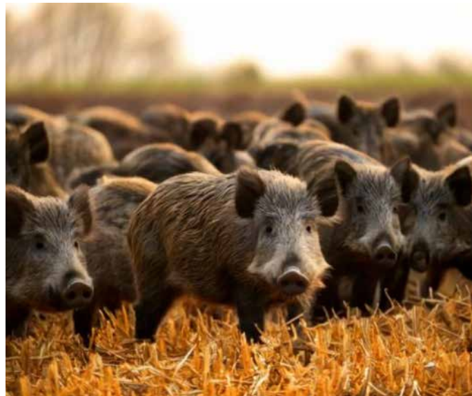
Fotografie vytvořena pomocí služby Adobe firefly

Co se týká myslivosti, je kladen důraz na etickou stránku lovu, tedy aby tato činnost probíhala tak, aby zvěř zbytečně netrpěla. Jak má tedy lov správně vypadat? Loví se buď palnou zbraní (lovecká puška), případně s loveckým dravcem. Lov s dravci bych jen krátce shrnul tak, že férovější způsob lovu budeme hledat jen stěží, kořist i lovecký dravec se střetnout v přímém souboji a zvěř, která unikne se již dále nepro následuje. Při lovu palnou zbraní pak používáme zbraně s energií výrazně přesahující sílu, která by byla pro lov minimálně potřeba. Hlavní motivací pro tento fakt je rychlé zhasnutí (usmrcení) zvěře, z toho důvodu existuje i pojem – myslivecká vzdálenost při střelbě. To je taková vzdálenost, kdy je střelec schopen bezpečně zasáhnout cíl do kritické oblasti, myslivecky řečeno na komoru (oblast srdce). Tato vzdálenost se pohybuje okolo 100–150 metrů u zbraně kulové, do 40–50 metrů u zbraně brokové. V případě