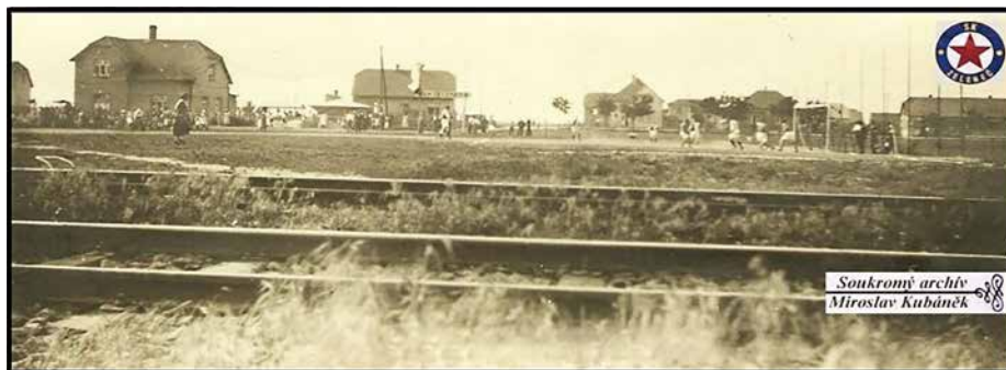
První hřiště v Zelenči