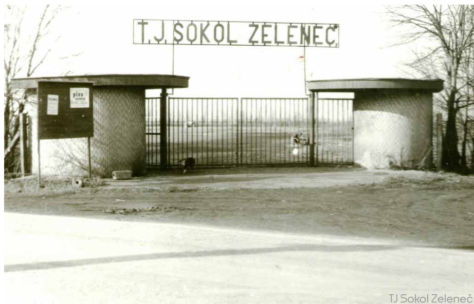
TJ Sokol Zeleneč