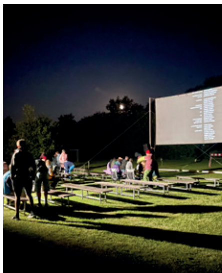
Z promítání filmu Nikdy neříkej nikdy

Na čtyři srpnové večery se na obecní louce usídlil Kinematograf bratří Čadíků a nabídl divákům filmy převážně z československé produkce včetně pohádky. Návštěvníci letního kina si tak mohli užít příjemné prázdninové večery pod hvězdami třeba s popcornem nebo pivem.