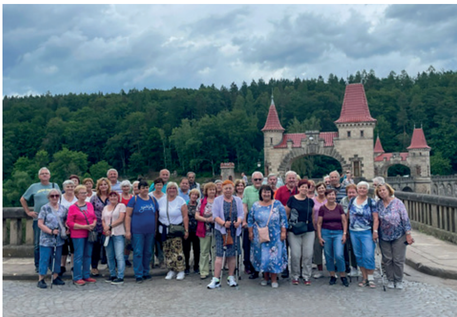
Skupina u přehrady Les Království