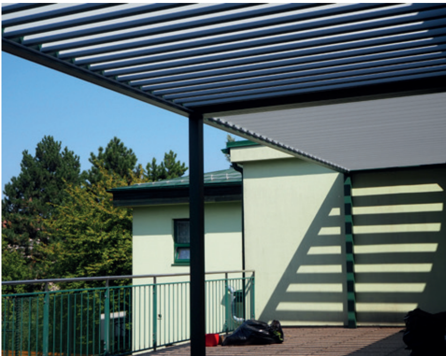
Nově zastřešená terasa

neumožňovalo a koloběžky se tak povětšinou válely jedna přes druhou. Nechali jsme se inspirovat v jiné škole a společně s Obcí Zeleneč jsme vybrali velmi univerzální stojany, které přesně pasují našim potřebám.