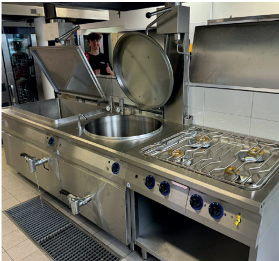
Nové technologie ve školní kuchyni