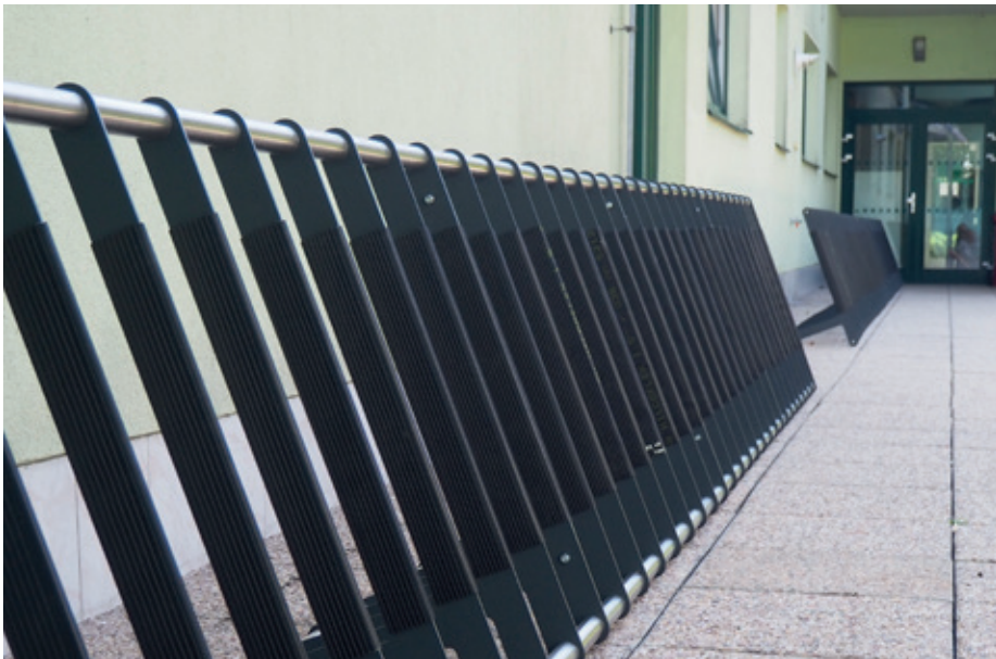
Nové stojany na kola a koloběžky

těšit na vzdušný hokej a další prvky pro aktivní vyžití na chodbách během přestávek. Pokračujeme ale i s budováním klidových zón a chodby na hlavní budově vybavujeme krásně barevnými