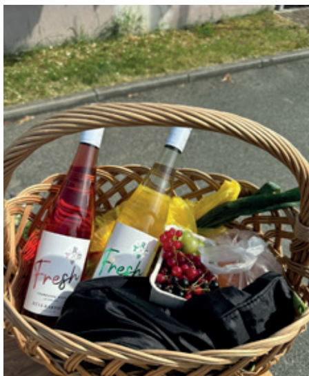
Nákup na pátečním trhu

V minulém vydání Zelenečského zpravodaje jste se mohli dočíst o našem novém projektu Trhy v Zelenči a také o tom, že začátky vůbec nebyly snadné. Rozhodli jsme se, i přesto že jsou prázdniny vždy zrádným obdobím k pořádání akcí, že nepolevíme a lokální prodejce do obce přivedeme i během července a srpna. Pravda, jen jednou za čtrnáct dní.