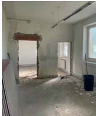
Rekonstrukce obecního úřadu