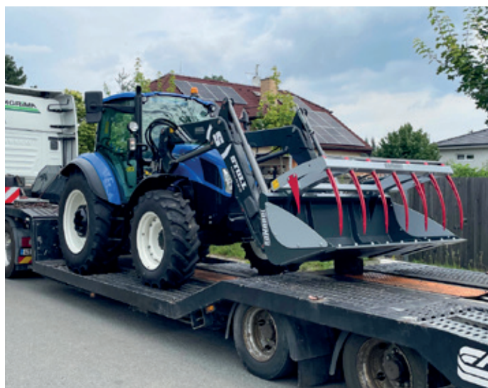
Nový traktor technických služeb