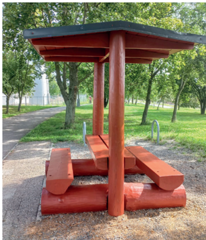
Altán u Bajkonuru