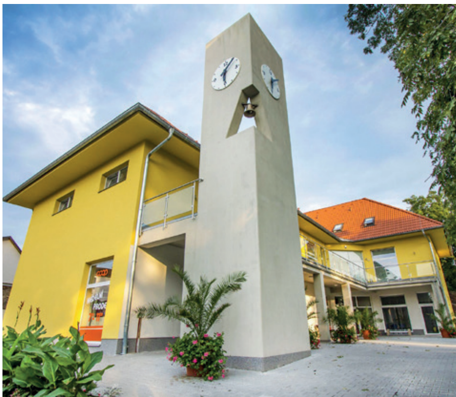
Multifunkční Obecní dům v Radonicích

odluzuje Zeleneč (směje se). Vzhledem k tomu, že pořád něco stavíme, je tu dost vytížený. Chlapům v technických službách šéfuje jeden ze zastupitelů a jsou celkem čtyři, k nim sezónně najímáme brigádníky. Plus máme obecní policii.