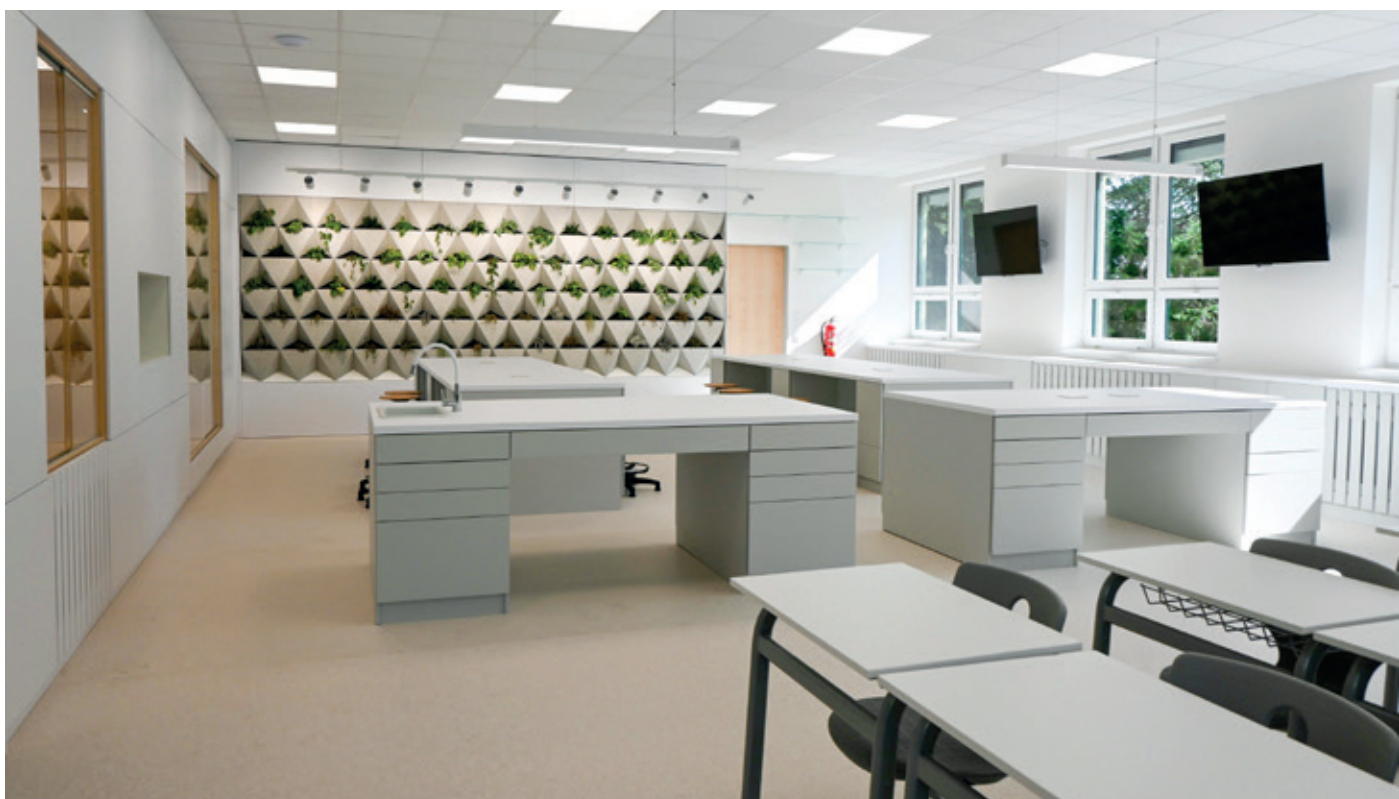
Vizualizace přírodovědné učebny