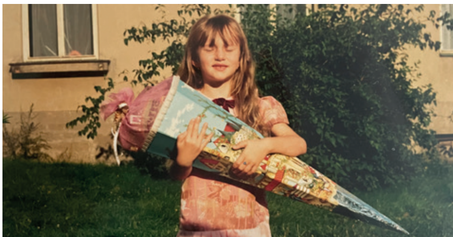
První školní den v roce 1991