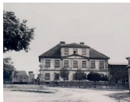
Budova tehdejší školy v Zelenči, rok 1934