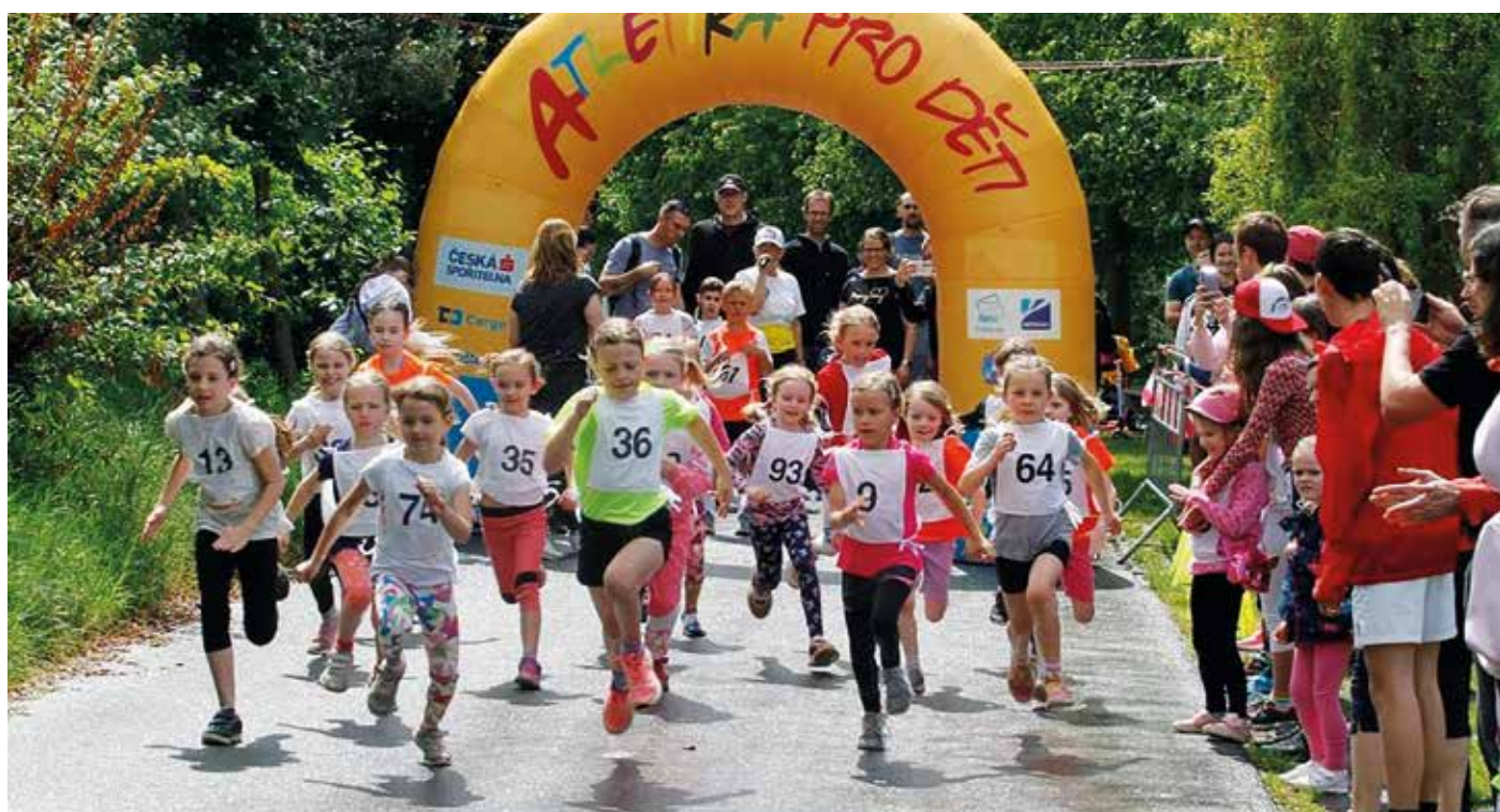
Start závodu dětí

Olga Nováková – Spolek rodičů a přátel ZŠ a MŠ Zeleneč