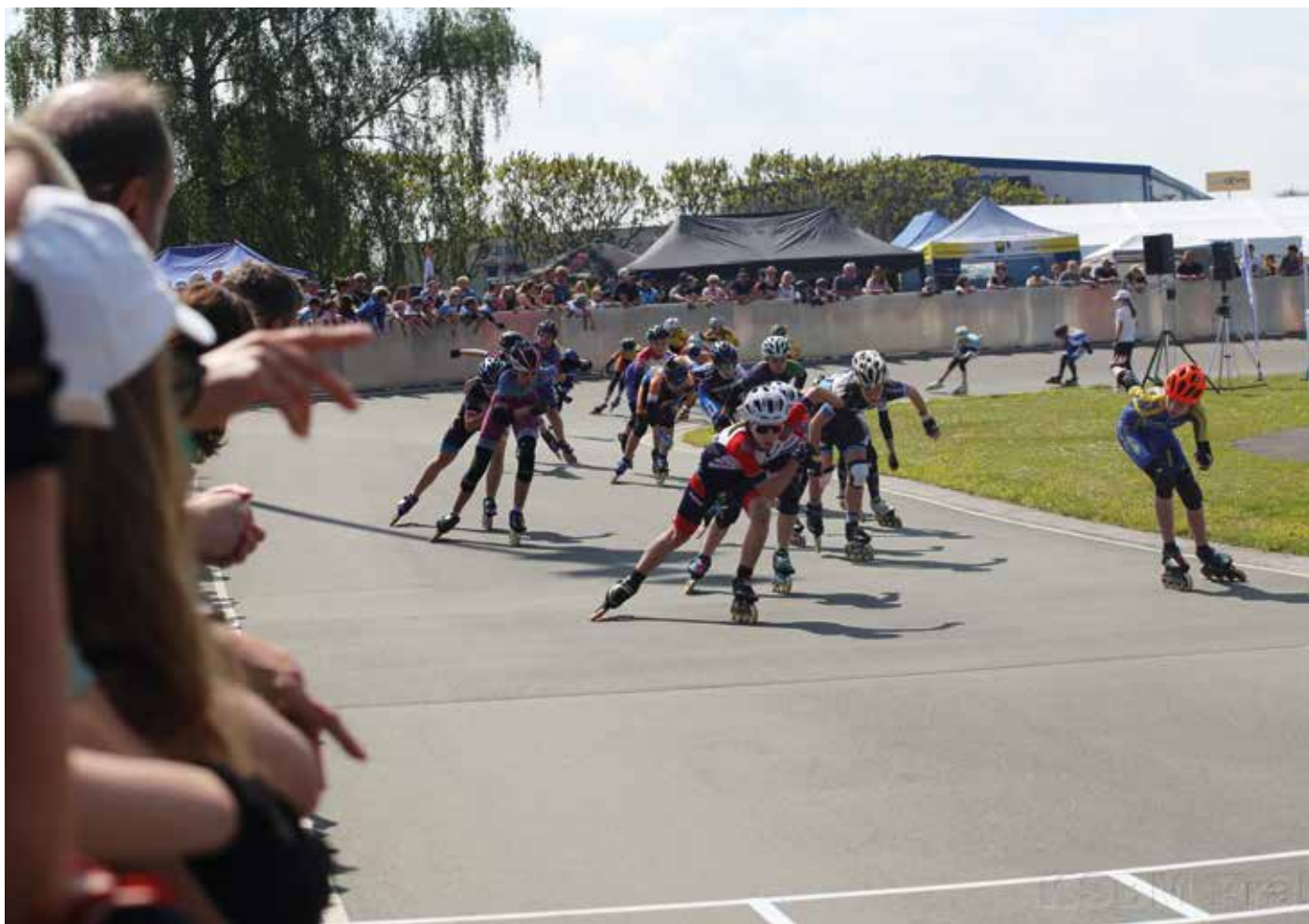
Závodníci in-line rychlobruslení včetně zástupců ze Zelenče