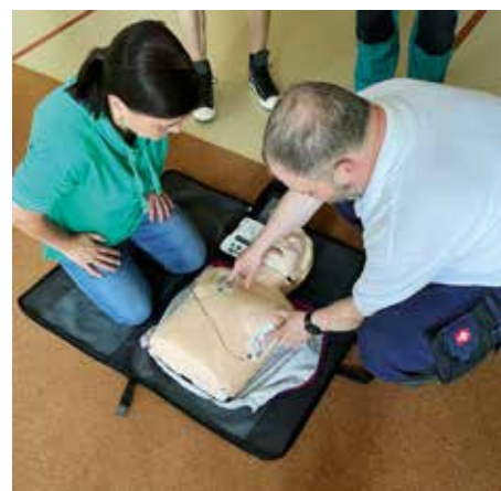
Referentka se školitelem při školení záchrany života.