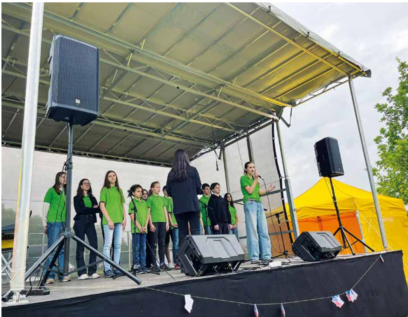
Mobilní pódium koupené z dotace od MAS Střední Polabí při oslavě Dne dětí