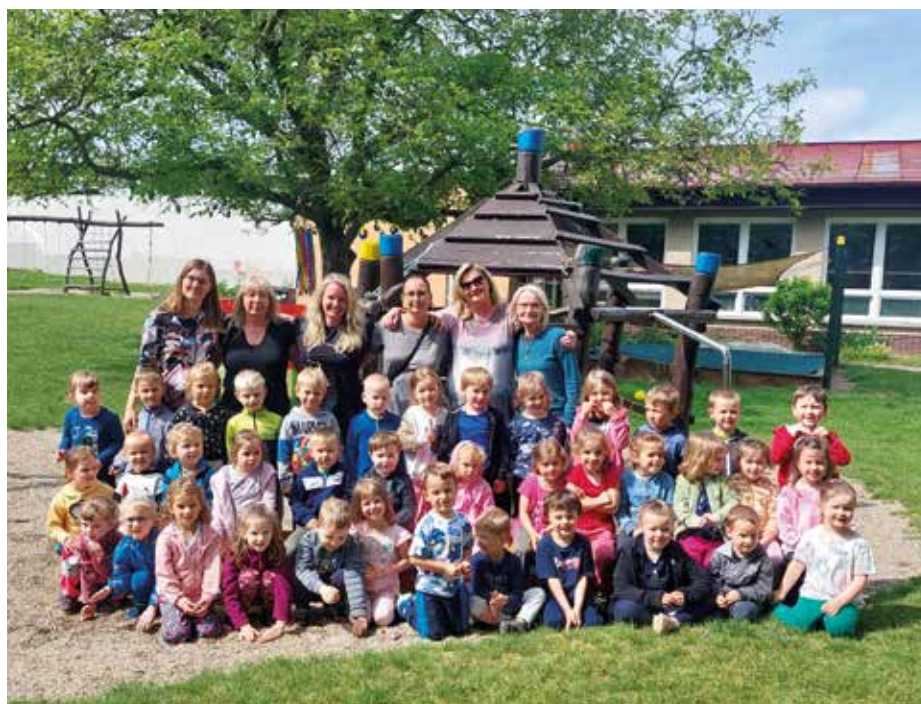
Děti a učitelky MŠ Zeleneč

Na začátku adventu byly školkou pořádány vánoční dílny. Zde si děti s rodiči užily hezké dopoledne, ve kterém si společně vyrobili vánoční výzdobu do svých domovů. Mikulášská nadílka se letos již podruhé konala ve spolupráci spolku rodičů, kteří oblékli kostýmy Mikuláše, anděla a čerta. Závěr roku jsme oslavili divadelním představením ve školce a vánočním posezením s rodiči.