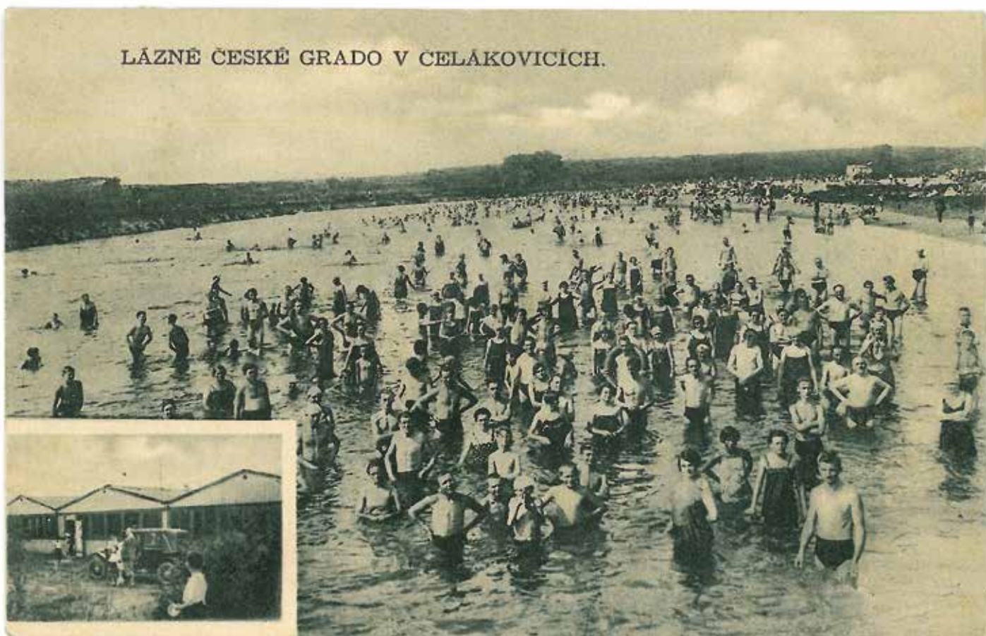
České Grado v roce 1932, pohlednice Městského muzea v Čelákovících