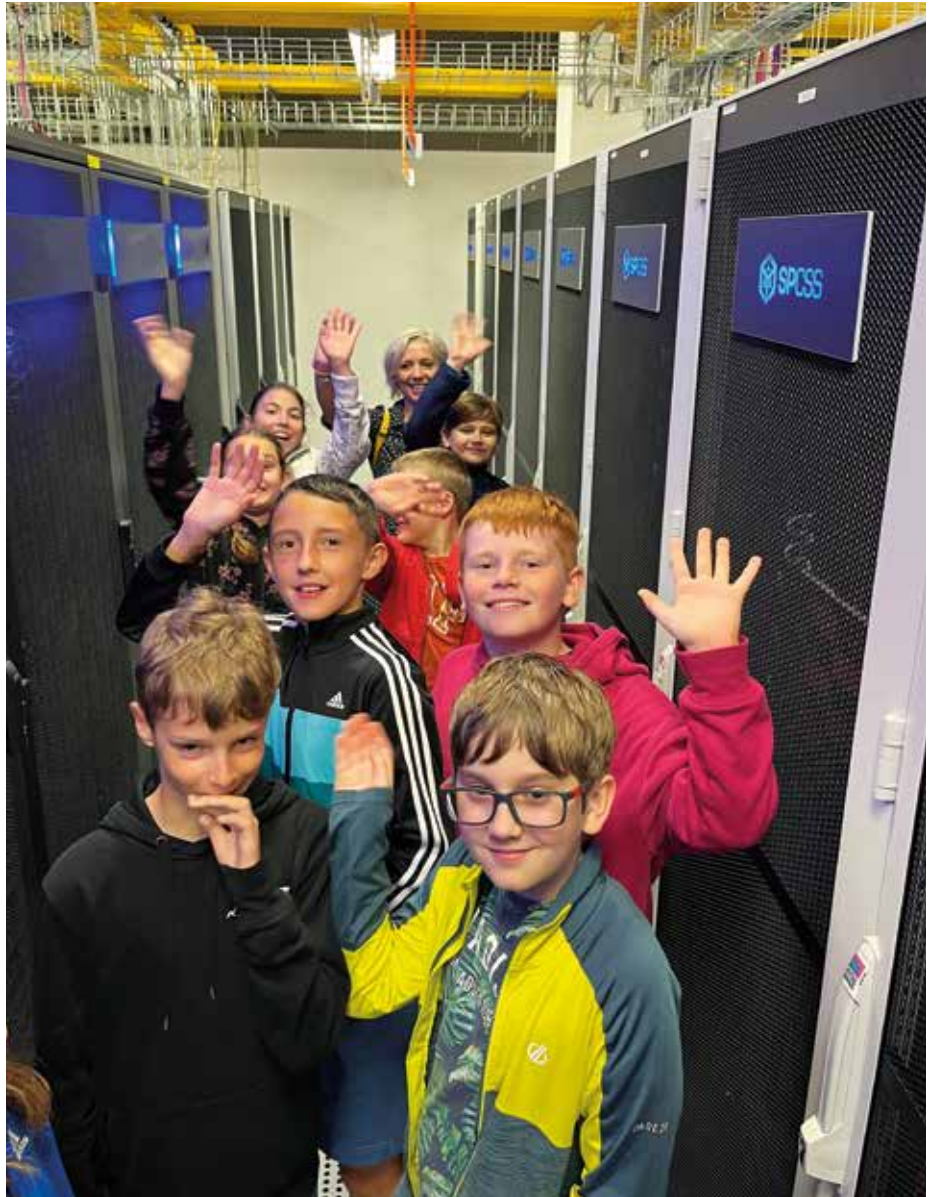
Děti ze ZŠ Zeleneč na návštěvě datového centra

Tento školní rok také přinesl mnoho nezapomenutelných zážitků a akcí, které nám všem zůstanou dlouho v paměti. Jedním z největších lákadel pro děti byly besedy, odborné přednášky a kulturní programy. Ať už šlo o návštěvy u nás, nebo výjezdy do divadel, muzeí či různých institucí, zejména v rámci kariérního poradenství. Právě v rozvoji kariérního poradenství se nám toho povedlo mnoho. Kromě přenesení těžiště poradenství do 8. ročníků jsme se také zapojili do projektu Den pro školu, díky kterému nás