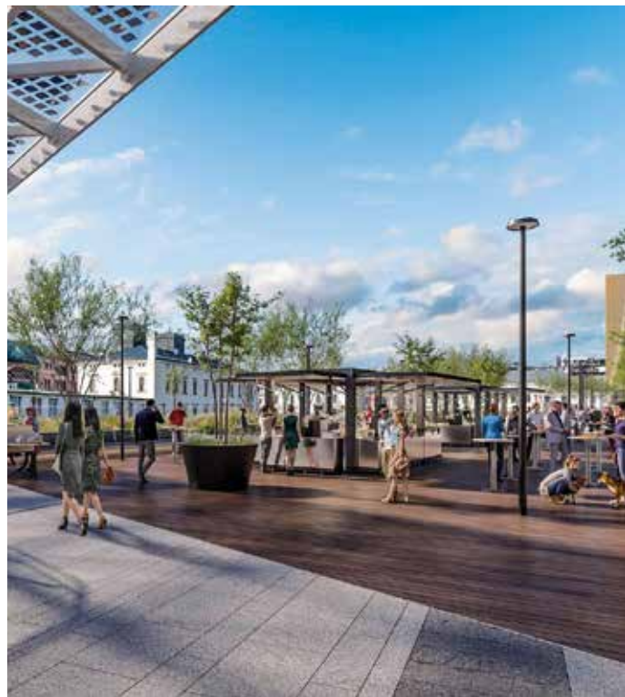
Vizualizace platformy nad kolejištěm na Masarykově nádraží

Ve směru ze Zelenče do Prahy zůstávají časy odjezdů i během letních prázdnin stejné, tj. vždy v celou hodinu a 12 min., 42 min. a 57 min. Z hlavního nádraží do Zelenče budou vlaky odjíždět vždy v celou hodinu a 20 min., 36 min. a 50 min.