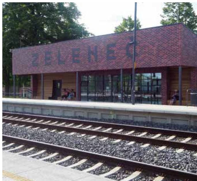
Současný vzhled vlakové zastávky