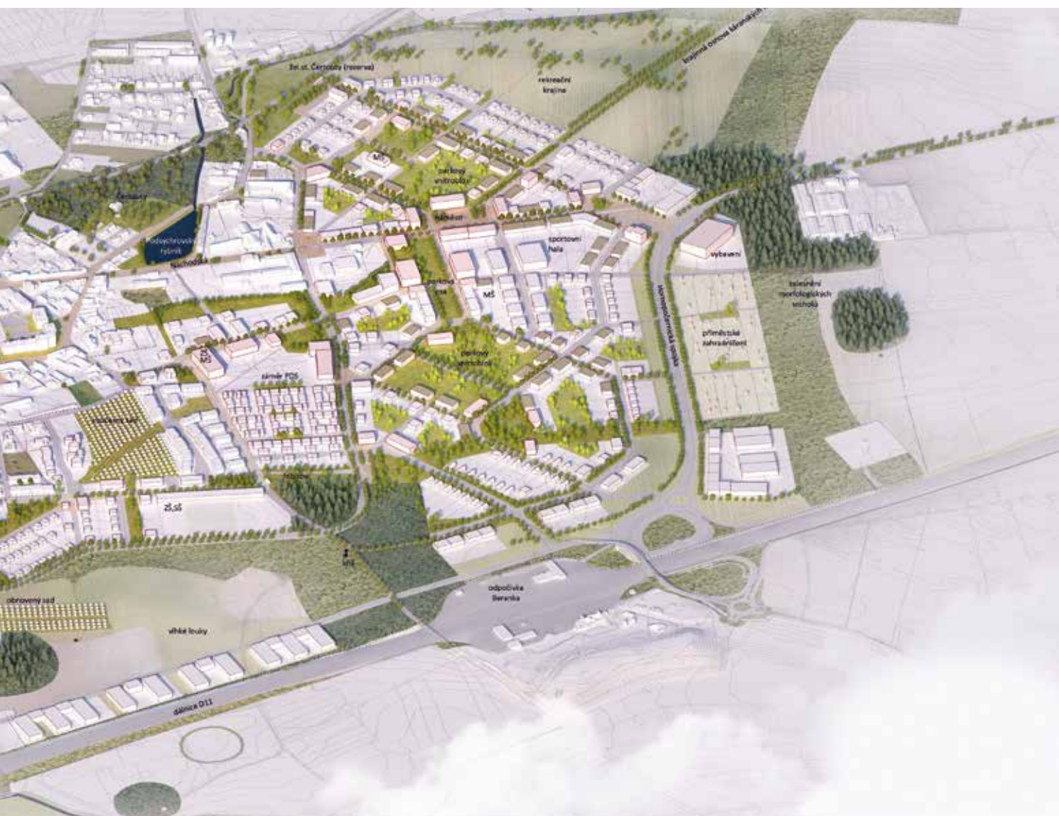
Vizualizace rozšíření Horních Počernic