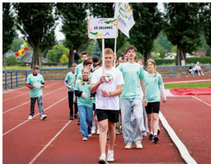
Žáci ZŠ Zeleneč na zahájení Dětské olympiády

Pro obec by to znamenalo širší nabídku sportovních aktivit pro širokou veřejnost. Rodiče a dospělí by mohli využívat běžecské dráhy, skokanské a vrhačské sektory, čímž by se podpořil