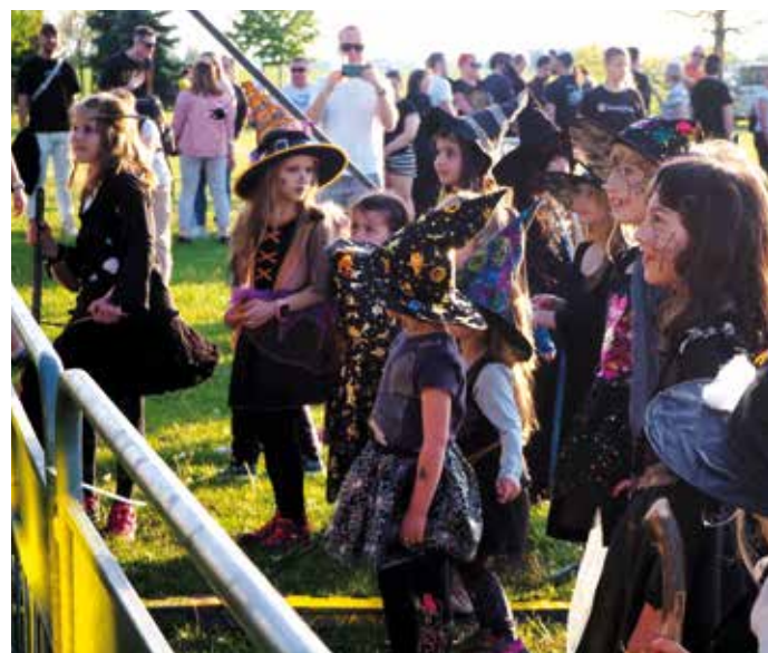
Malé čarodějnice na Zelenečských čárách