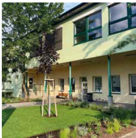
Nová podoba zelených ploch před ordinacemi lékařek