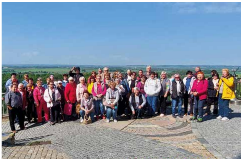
Spolek u vyhlídkové místa v Mělníku

Poté jsme absolvovali prohlídku zámku, kde dodnes žijí Lobkovicové. Naše průvodkyně byla velmi znalá a díky ní jsme se dozvěděli mnoho zajímavých informací o historii i současnosti tohoto místa. Po chutném obědě jsme se přesunuli k Regionálnímu muzeu, kde nás čekala spousta zajímavostí o historii Mělníka, ale skutečným vrcholem byla výstava kočárků ze zaniklé Liberty. Mnozí z nás v těchto kočárkách vozili své děti, a vidět zde i starší modely, ve kterých nás vozili naši rodiče, bylo dojemné. Dětské