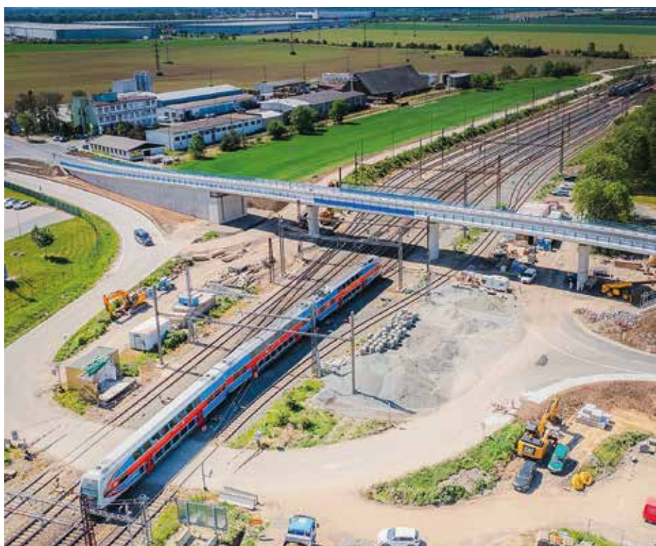
Nový most přes železniční trať