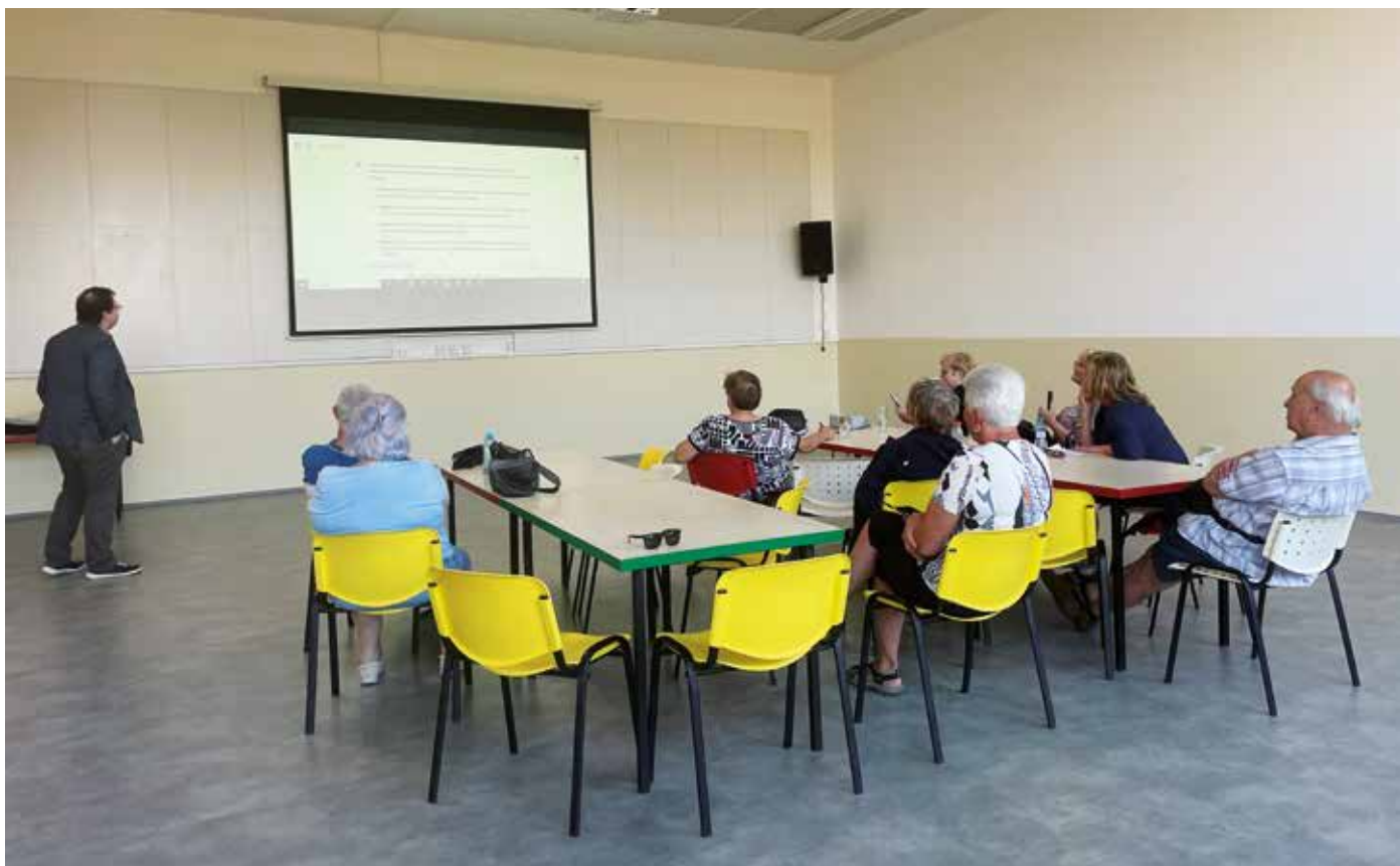
Beseda o Nástrahách každodenního života